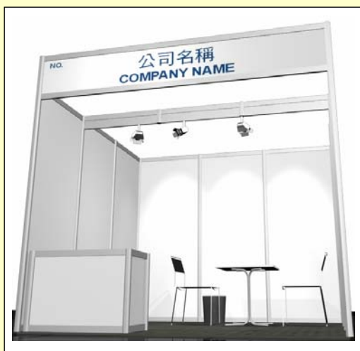
Perspective View (9sqm) 透視圖